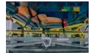
Stoß nach oben