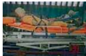
Aufprall in Fahrtrichtung

In Verbindung mit den drei Komponenten fußseitige Auffangsicherung, seitliche Auffangsicherung und Kopfteilverlängerung wurde das Material Beschleunigungskräften von bis zu 10 G ausgesetzt, das entspricht einer Aufprallgeschwindigkeit von etwa 35 km/h!