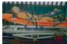
Aufprall in Fahrtrichtung

In Verbindung mit den drei Komponenten fußseitige Auffangsisicherung, seitliche Auffangsisicherung und Kopfteilverlängerung wurde das Material Beschleunigungskräften von bis zu 10 G ausgesetzt, das entspricht einer Aufprallgeschwindigkeit von etwa 35 km/h!