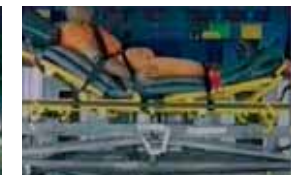
Stoß nach oben